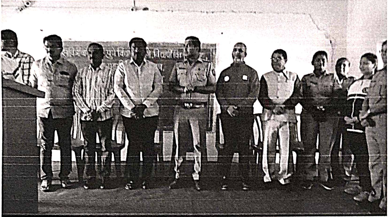
निर्भय कन्या अभियान उदघाटन आणि स्वसंरक्षण प्रशिक्षण